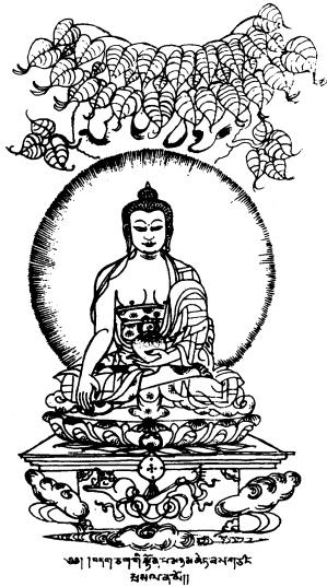
Phật Thích Ca Mâu Ni Lama Zopa Rinpoche phát họa

Tựa đề tiếng Anh: The Noble Mahayana Sanghatasutra Dharma-Paryaya